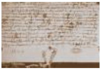
Morgengave brevet 1229